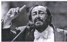
Luciano Pavarotti

Luciano Pavarotti sei zwar ein gläubiger Mensch gewesen und habe sich sehr für den Dalai Lama begeistert. "Was ihm aber in seinen letzten Monaten am meisten geholfen und gestützt hat, war seine